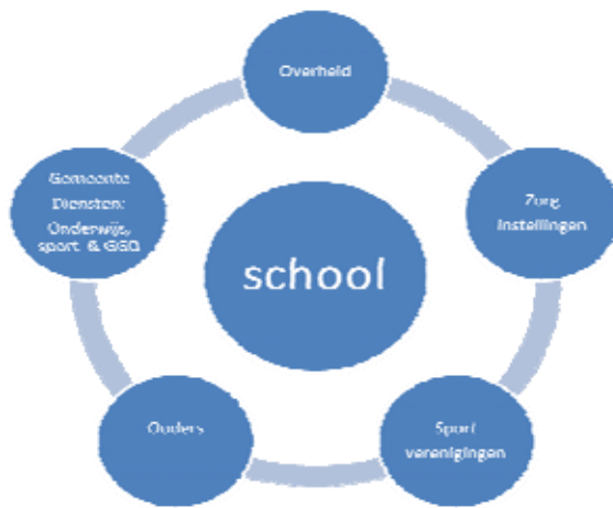
(fig. 1: onderwijsveld)

school zelf worden uitgevoerd. Dit zijn respectievelijk Wijkarrangementen en het Verlengde Dag Arrangement (VDA). Het schoollunchprogramma zou hierbij kunnen aansluiten. Die eerste ring van betrokken groepen levert de volgende grafisch voorstelling op: