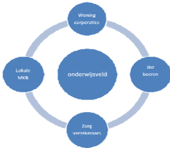
(Fig.2: infrastructurale back up)